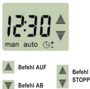
(Abb. 2) LCD-Display: