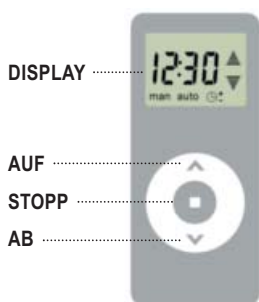
(Abb. 1) Tastenbelegung: