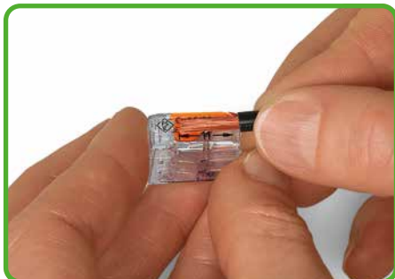
Leiter 11 mm abisolieren.