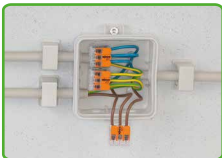
Verdrahtung feindrätiger Leiter in Installationsdosen