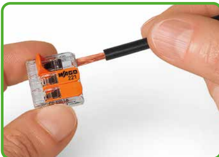
Leiter anschließen: Klemmstelle durch Betätigungshebel öffnen und Leiter einführen.