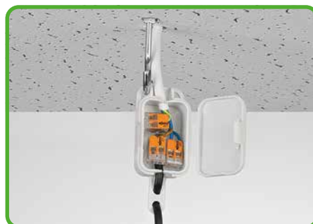
Anschluss von Pendelleuchten in abgehängten Decken

Der CAGE CLAMP®- Anschluss klemmt folgende Kupferleiter:*