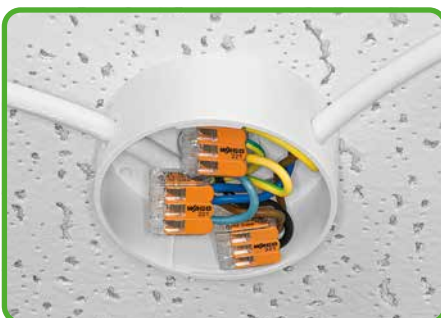
Leuchtenverteilung in Deckenbaldachin